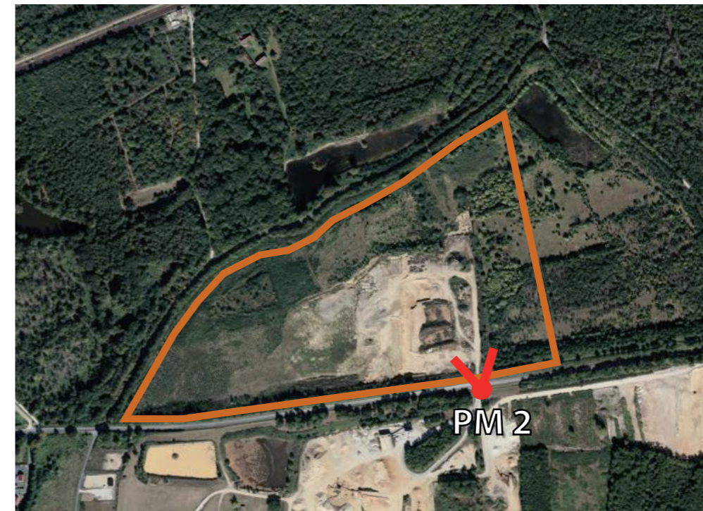
Localisation de la prise de vue