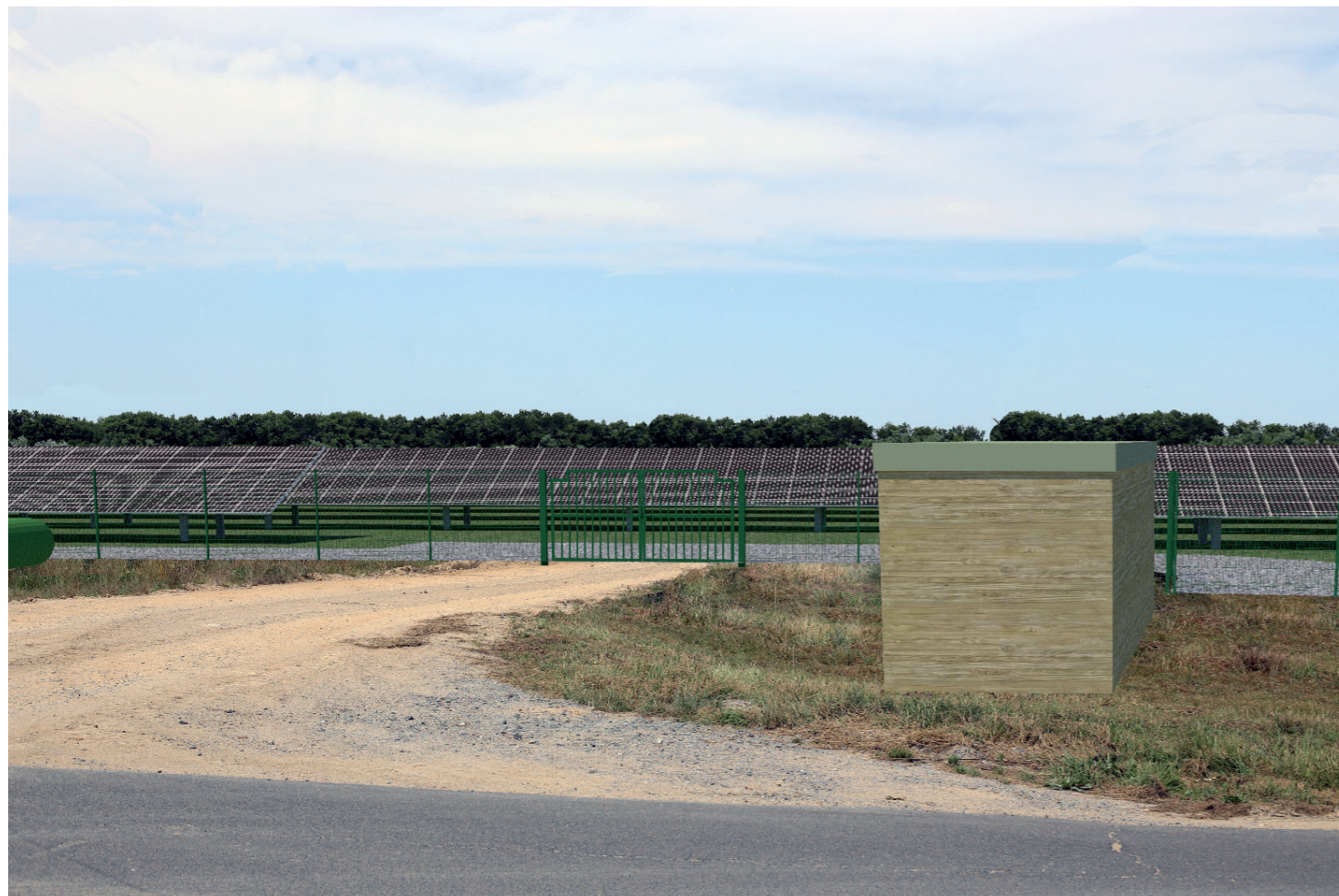
PHOTOMONTAGE 2 - Phase exploitation