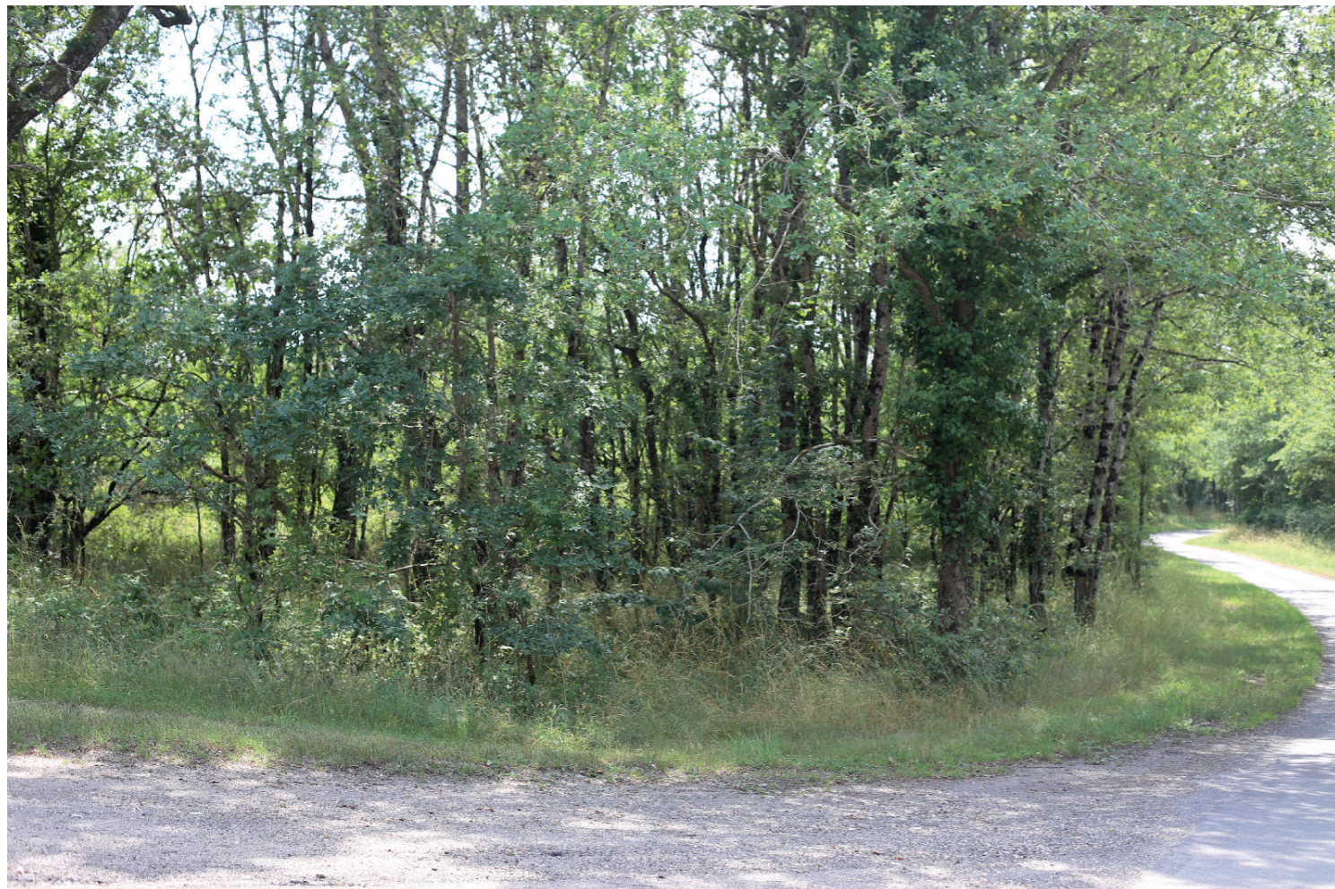
PHOTOMONTAGE 4 - Phase exploitation