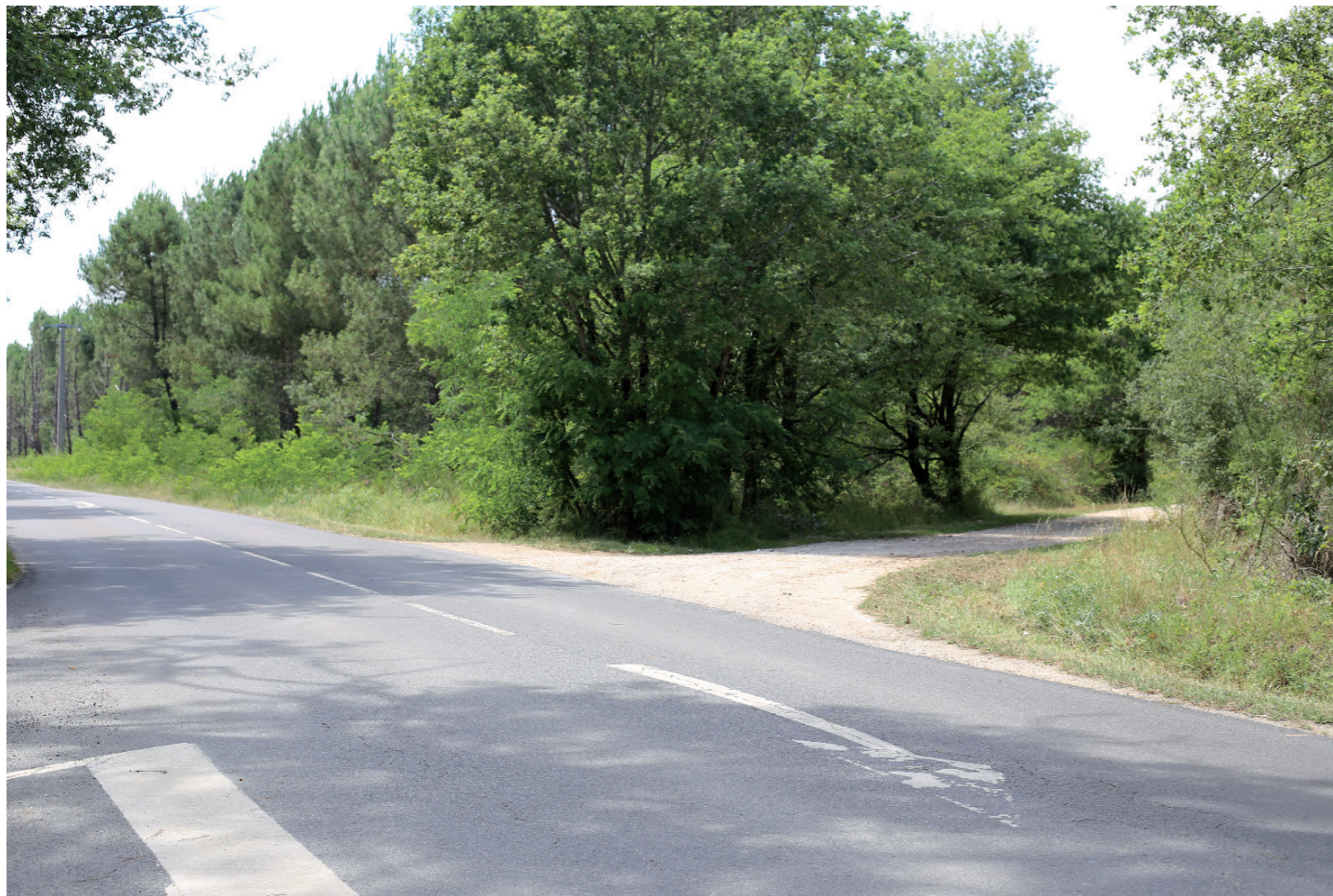
PHOTOMONTAGE 3 - Situation existante