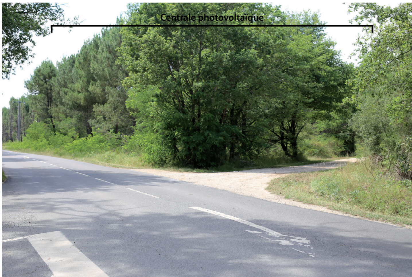
PHOTOMONTAGE 3 - Phase exploitation