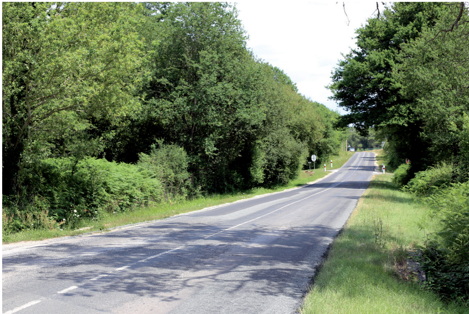
PHOTOMONTAGE 1 - Situation existante