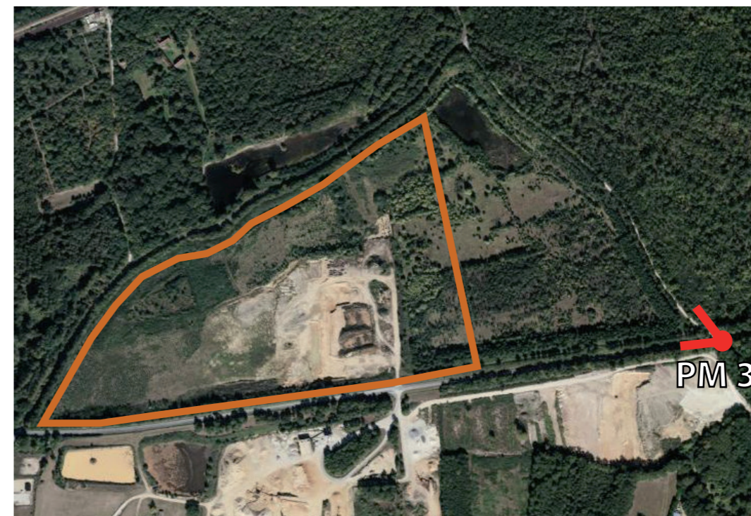
Localisation de la prise de vue