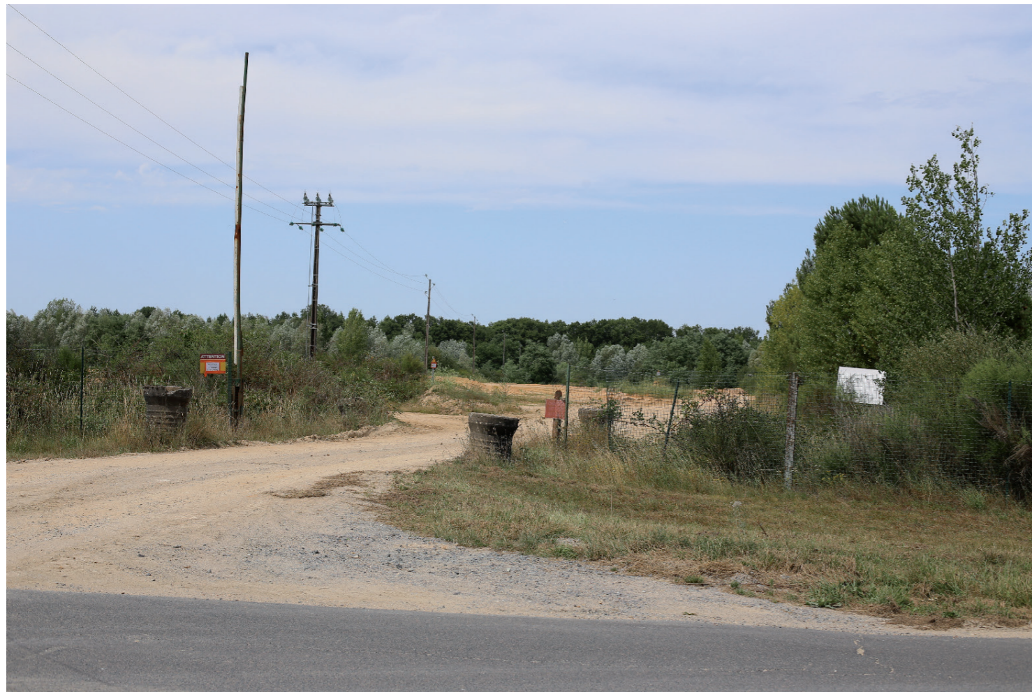
PHOTOMONTAGE 2 - Situation existante