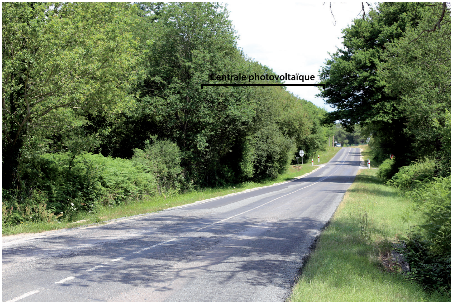
PHOTOMONTAGE 1 - Phase exploitation