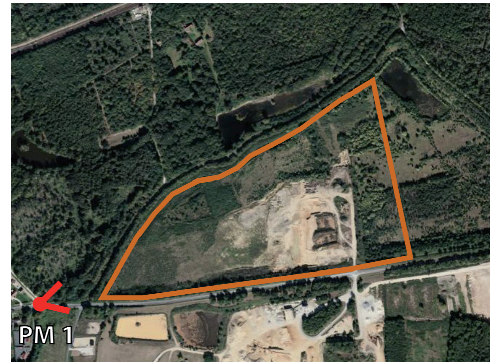
Localisation de la prise de vue