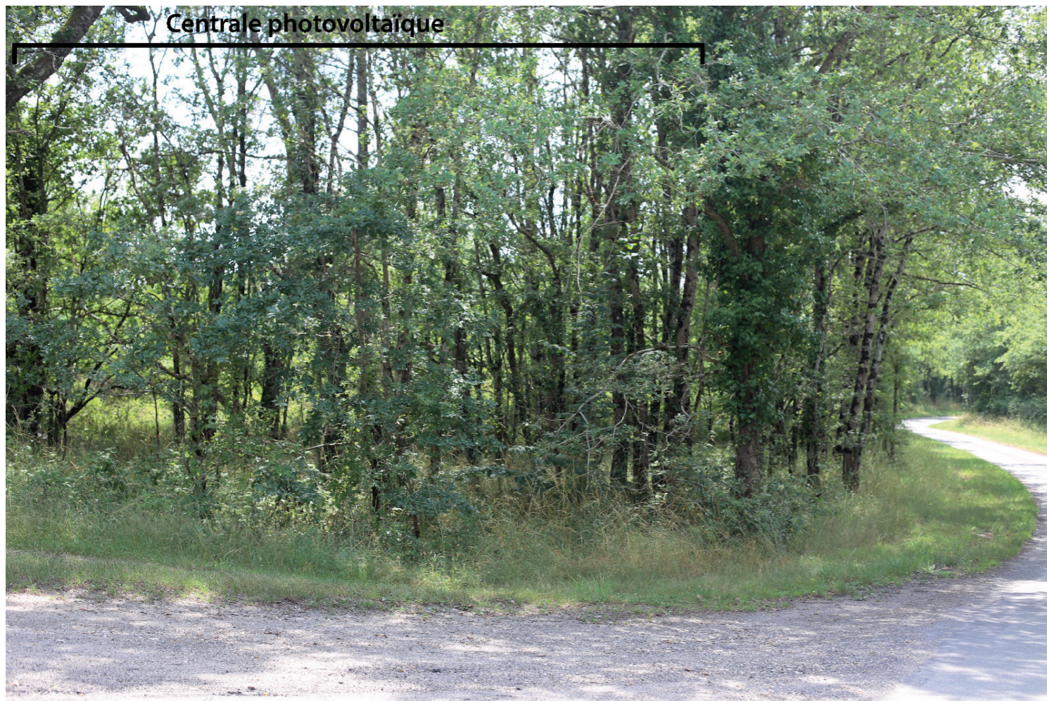
PHOTOMONTAGE 4 - Situation existante