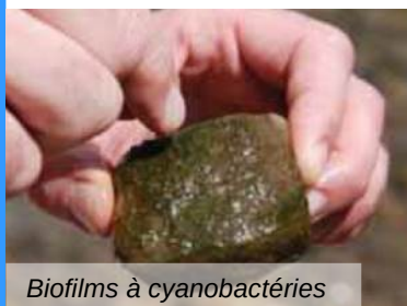
Biofilms à cyanobactéries